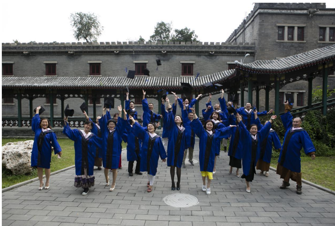
（上图为部分毕业学员合影）